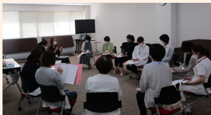
ロールプレイの様子